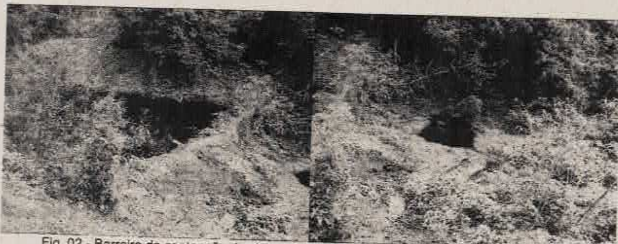
Fig. 02 - Barreira de contenção de chorume e pontos de contaminação por este poluente.

Chegando ao local, verificamos que a empresa não está gerindo o aterro sanitário de forma adequada. Encontramos pontos de vazamento de chorume e a lagoa de acumulação deste líquido preste a transbordar. Este cenário está mais crítico devido o período chuvoso na região, aumentando a geração de chorume.