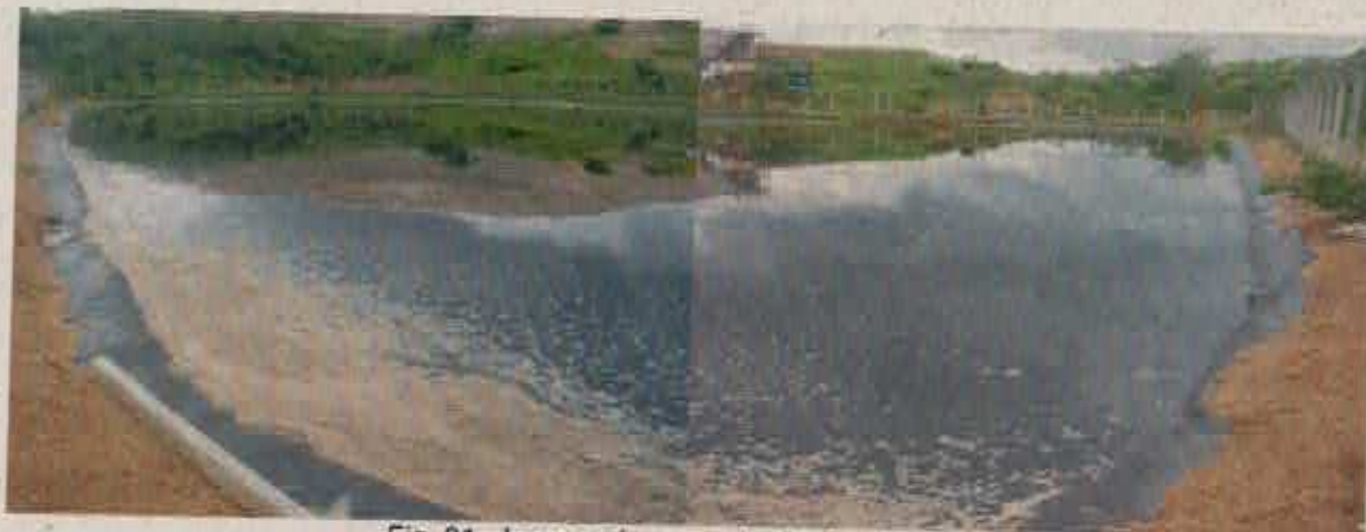
Fig. 01 - Lagoas de acumulação de chorume.

A inspeção foi realizada para verificar as condições de operação do aterro sanitário, principalmente com relação ao chorume gerado na decomposição dos resíduos sólidos urbanos, visando uma melhor análise do Plano de Gerenciamento de Áreas Contaminadas que será apresentado.